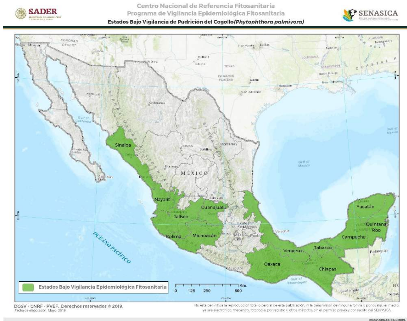
Figura 2. Vigilancia Epidemiológica Fitosanitaria de Phytophthora palmivora . Elaboración propia con datos de SADER-SENASICA-PVEF, 2019b.

Yucatán (Figura 2), de esta manera, para el año referido, se tiene programada la exploración de 15,570 hectáreas con cultivos hospedantes y el establecimiento de 75 rutas de vigilancia en sitios de riesgo de entrada y zonas potenciales para el establecimiento de la plaga (SADER-SENASICA-PVEF, 2019).